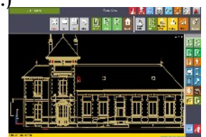
levé de façades